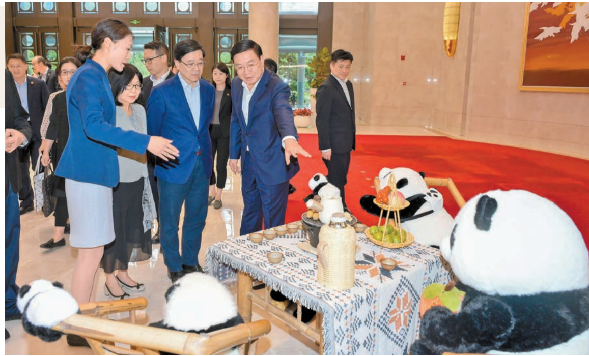
行政長官李家超與夫人（前排右二及三）在成都市市長王鳳朝（前排右一）陪同下觀看展品。

此外，全國人大常務委員會委員李慧琼表示，感謝中央對香港關心和厚愛，再次向香港送贈一對國寶級