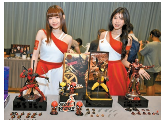
香港動漫電玩節將於7月26日至30日在會展舉行。圖為參展商推出限定版人偶。

據介紹，香港動漫電玩節門票分成4種，普通門票維持42元，今年加設兒童票每張20元，兒童須由成人陪同，可以經由特設親子通道入場。另設150元的潮巨匠「玩具放暑假」閃咭珍藏門票，更能在特別通道1B入口進場；而300元3回特快入場券，可從特別通道1B入口進場。