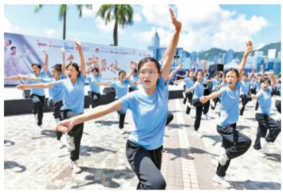
「武林盛舞嘉年華」昨日起一連六日舉行，主辦單位於香港文化中心舉行開幕禮，並即場舉行一千人武術操等節目。

【香港商報訊】記者周偉立報道：為慶祝香港回歸27周年，盛事基金資助的全港首個武術與舞蹈相匯的文化藝術嘉年華「武林盛舞嘉年華」昨日於尖沙咀香港文化中心開幕，一連6天為香港帶來超過60場的中華文藝盛典。主辦單位希望藉今次嘉年華彰