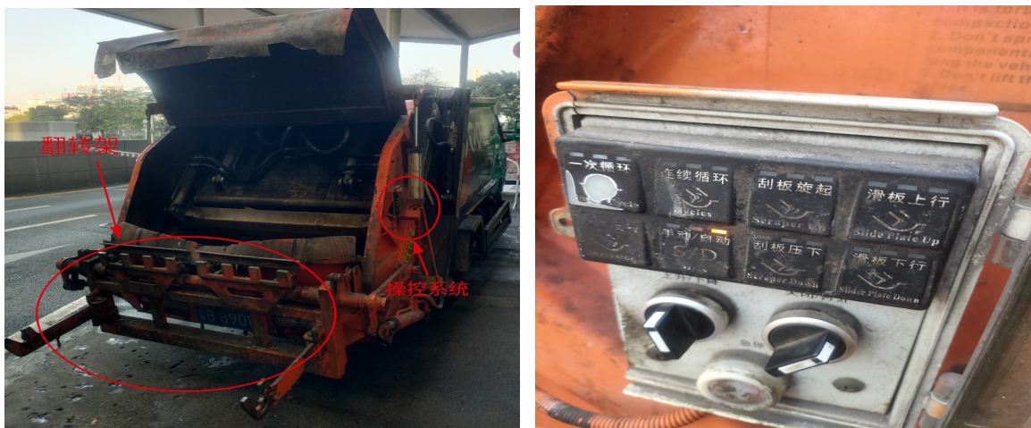
图 2：涉事垃圾清运车及按钮开关情况

涉事垃圾清运车所有人为深圳市宝记再生资源有限公司，车牌号：粤 B890W6，非营运轻型特殊结构货车，外廓尺寸 5995x1950x2280mm。垃圾清运车由环卫车专用底盘和上装部分组成，上装部分的压缩箱由厢体、刮板、填装器、翻转架、液压系统、操控系统等主要附件组成。经调查，操控系统设置在涉事垃圾清运车垃圾压缩箱的右侧，由 8 个分项按钮、2 个旋转开关和 1 个急停开关组成，经现场测试，操控系统设置可正常操作使用，涉事垃圾清运车无故障。（见图 2）