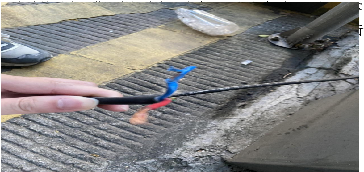
图 4 电源线路接驳线工作零火线情况

（二）道闸电源插头连接在旁边保安室的固定插座上，道闸主机电源与智能识别车牌系统电源串联使用。保安室设置了室内漏电保护开关，单极 DZ47LE-63 的漏电保护开关，动作电流为