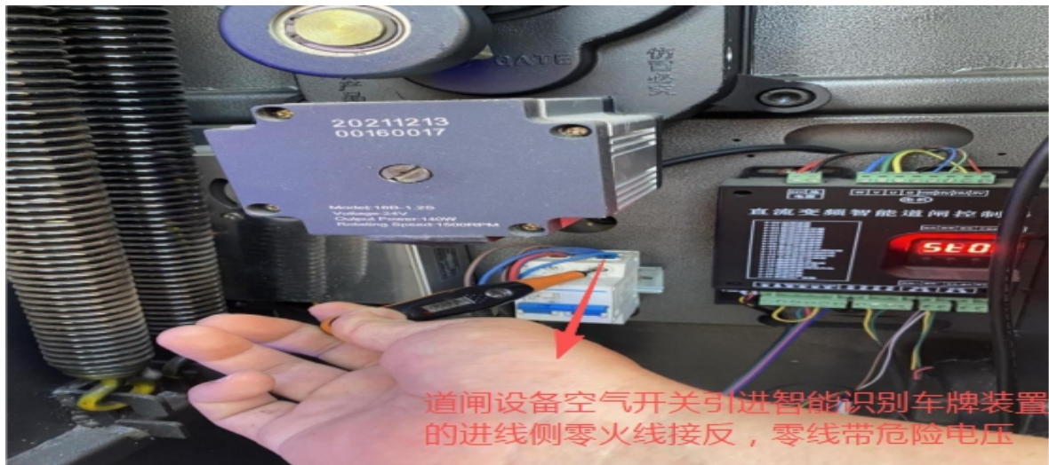
图 7 道闸线路零火线接反图片

(四) 在保安室将道闸设备线路通电后，采用数字万用表电压档测试，发现零线带有 207V 危险电压。(见图 8)