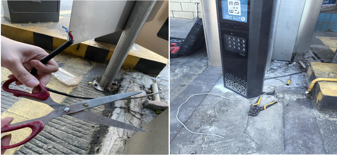
图 2 电工作业工具情况