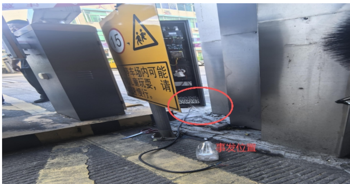
图 1 事发现场图片

车到达华南城工业区停车场道闸位置进行系统升级设备更换工作。华南城工业区电工阳永建和王某云对接后询问系统升级设备更换要不要关闭道闸电源，王某云回复不需要关闭道闸电源，然后阳永建离开。王某云先拆除旧道闸车牌识别装置，旧道闸车牌识别装置拆除后，将新的道闸智能车牌识别装置安装固定在地面，然后将道闸电源线准备与新更换的智能车牌识别装置连接时倒在地面。（见图 1）