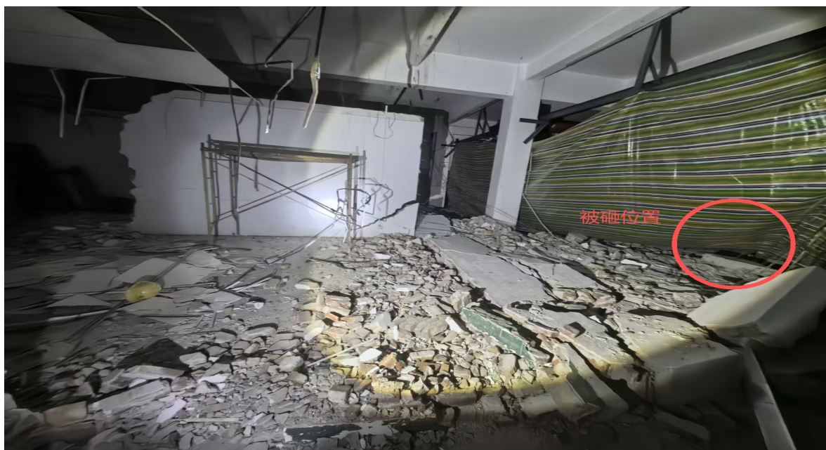
图 1 事故现场图片