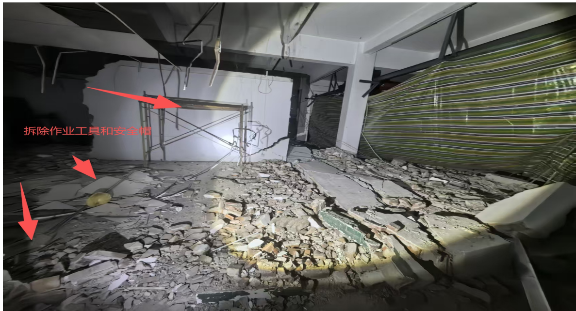
图 5 现场拆除作业工具

3. 现场拆除作业可见门式操作平台、安全帽、锤子等作业工具，拆除作业现场未设置硬质封闭围挡及安全警示标志。（见图 5）