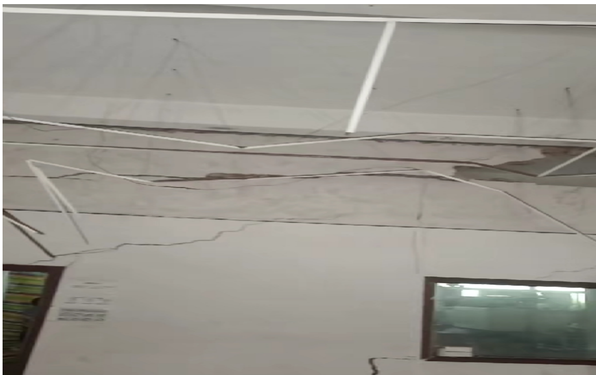
图 2 开工前隔墙开裂情况

鸿永利工业园 F 栋 102 厂房面积约 500 m 2 ，为框架结构，分隔为生产区域和办公区域。经调查，根据开工前拍摄的视频内容显示，鸿永利工业园 F 栋 102 厂房办公区域的隔墙墙体存有斜向、纵向、水平大小不一的贯穿性裂缝。（见图 2）