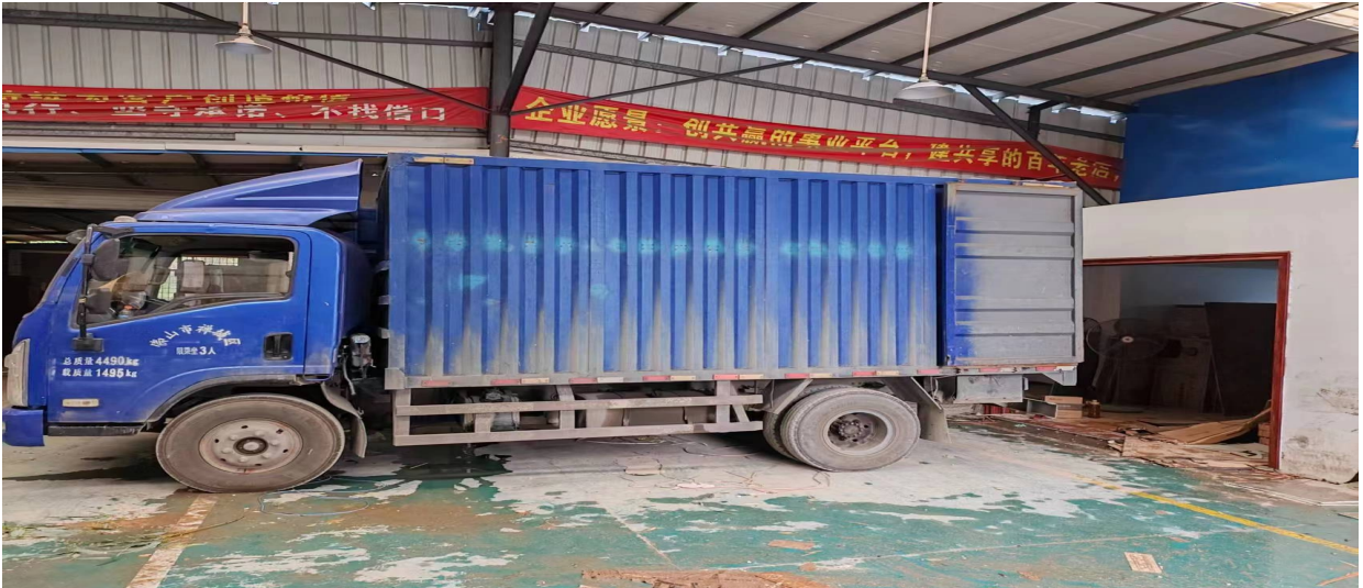
货物运输车辆图片

(二) 货物运输车辆情况。货物运输车辆为十通牌轻型厢式货车，外廓尺寸：5995×2140×3110mm，货厢为钢板材质，检验有效期至2023年8月。