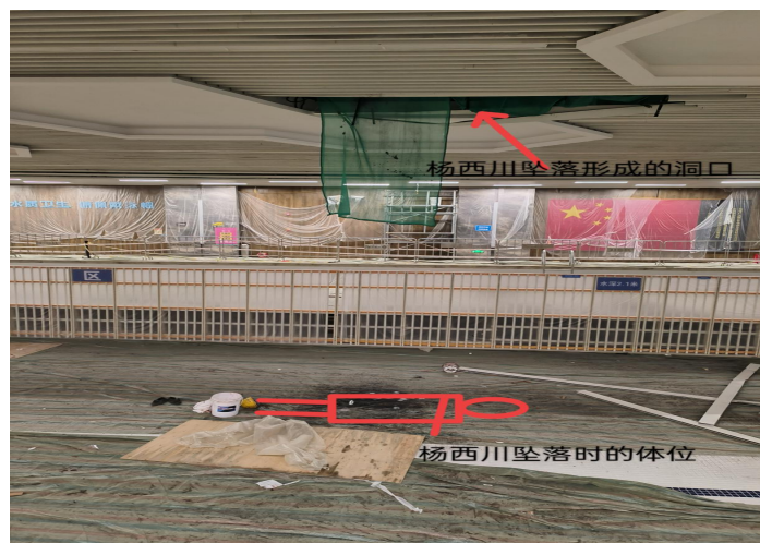
图 3 杨某某坠落时的体位和形成的洞口

（四）作业现场及劳动防护用品情况。博探公司给作业人员配备了安全帽、安全带等劳动防护用品。经调查，杨某某作业过程中佩戴了安全帽、安全带，但是现场未设置安全带系挂点，未系挂安全带。