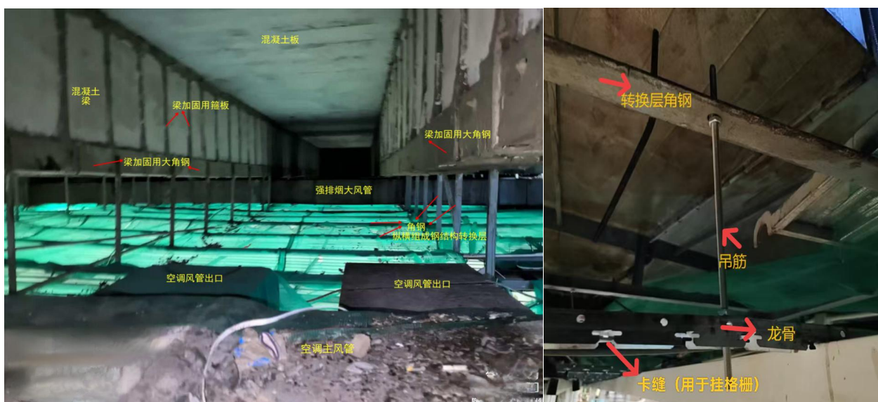
图 2 转换层及天花内部构件图

(二) 三级教育情况。2025 年 9 月 2 日，杨某某参加了博探公司新工人入场三级安全教育，工种：油漆工，教育人：周某某、吴某某，教育内容包括安全基础知识、法规、法制教育、现场规章制度和遵章守纪教育、本工种岗位安全操作及班组安全制