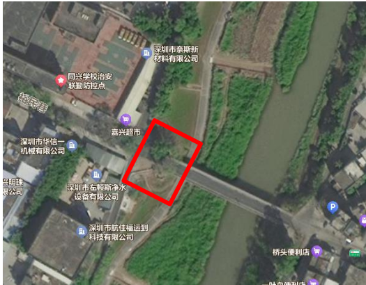
东雅路(马塘桥)位置示意图