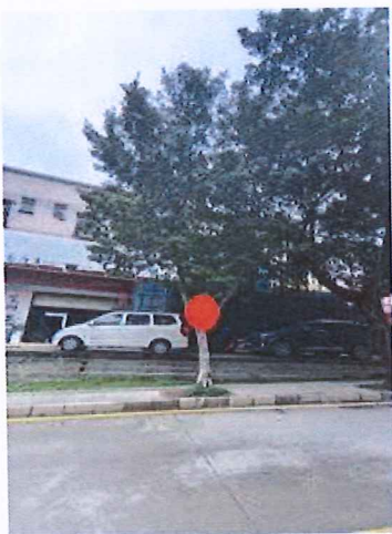
序号: 7 小叶榕 胸径21cm 树龄11年