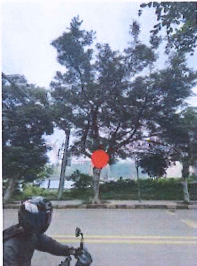
序号: 13 小叶榕 胸径39cm 树龄20年