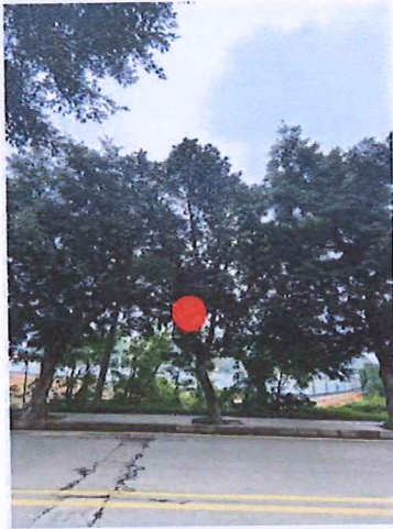
序号: 4 菠萝蜜 胸径28cm 树龄14年