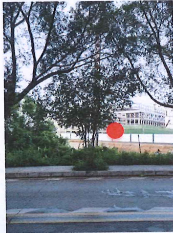
序号: 5 垂叶榕 胸径8cm 树龄5年