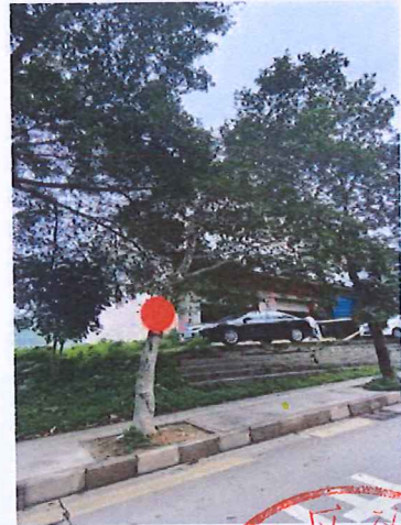
序号: 6 小叶榕 胸径19cm 树龄10年