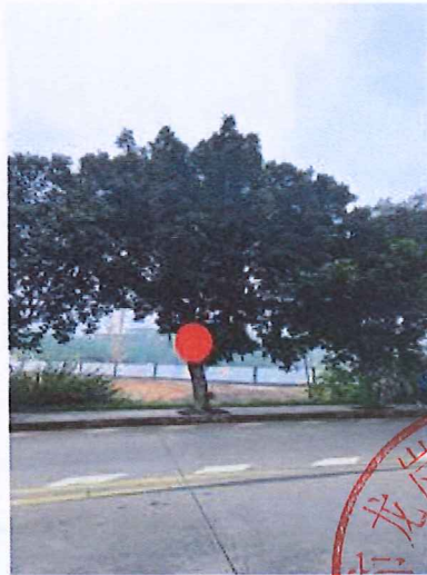
序号: 14 小叶榕 胸径40cm 树龄21年