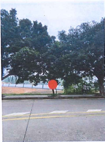
序号: 1 菠萝蜜 胸径13cm 树龄7年