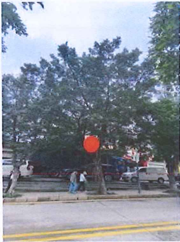
序号: 10 小叶榕 胸径37cm 树龄19年