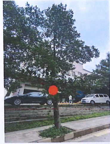
序号: 3 菠萝蜜 胸径23cm 树龄11年