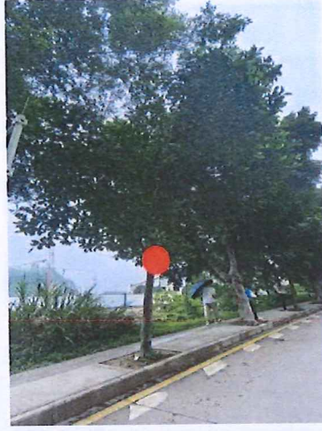
序号: 2 菠萝蜜 胸径16cm 树龄8年