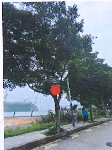
序号: 8 小叶榕 胸径31cm 树龄15年