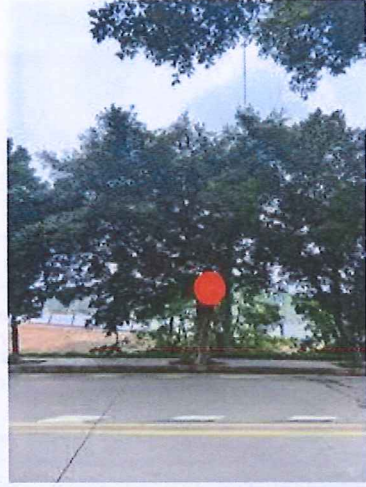
序号: 12 小叶榕 胸径39cm 树龄20年