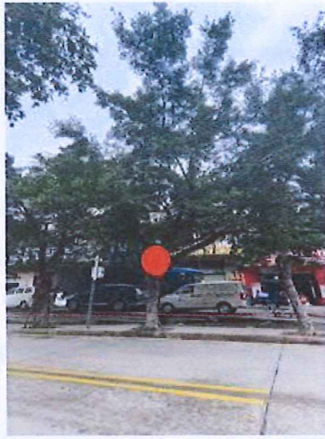
序号: 11 小叶榕 胸径37cm 树龄19年