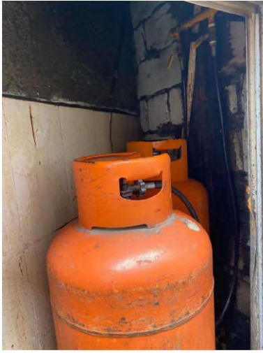
龙城街道新陂路 31 号（良良木桶饭店）， （一）5、气瓶间未安装自动喷灭火球